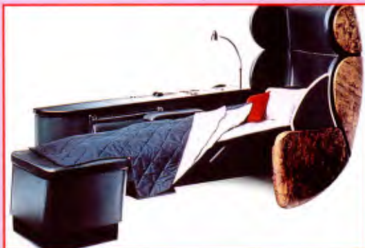
Novas poltronas: Swissair reformula 1ª classe entre Zurique e São Paulo

A Swissair instalou, no início do ano, novas poltronas em suas linhas regulares entre Zurique (Suíça) e São Paulo (SP), como parte do "Care Programme", que prevê uma reformulação total dos serviços de primeira classe da companhia aérea. Inspiradas na estética da Lounge Chair , que foi projetada em 1956 pelo arquiteto norte-americano Charles