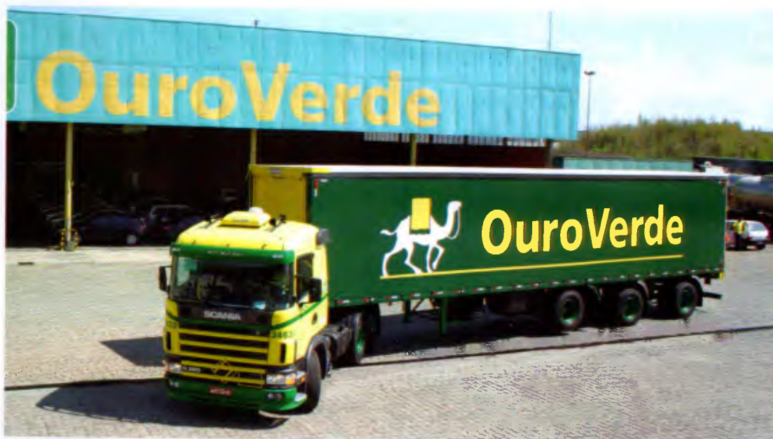
Frota da Ouro Verde é de 162 cavalos-mecânicos, 395 carretas lonadas, 30 caminhões tocos e trucados e 140 carretas-tanque

co, poderemos optar pela totalidade da frota própria em carretas de eixos espaçados", afirma.